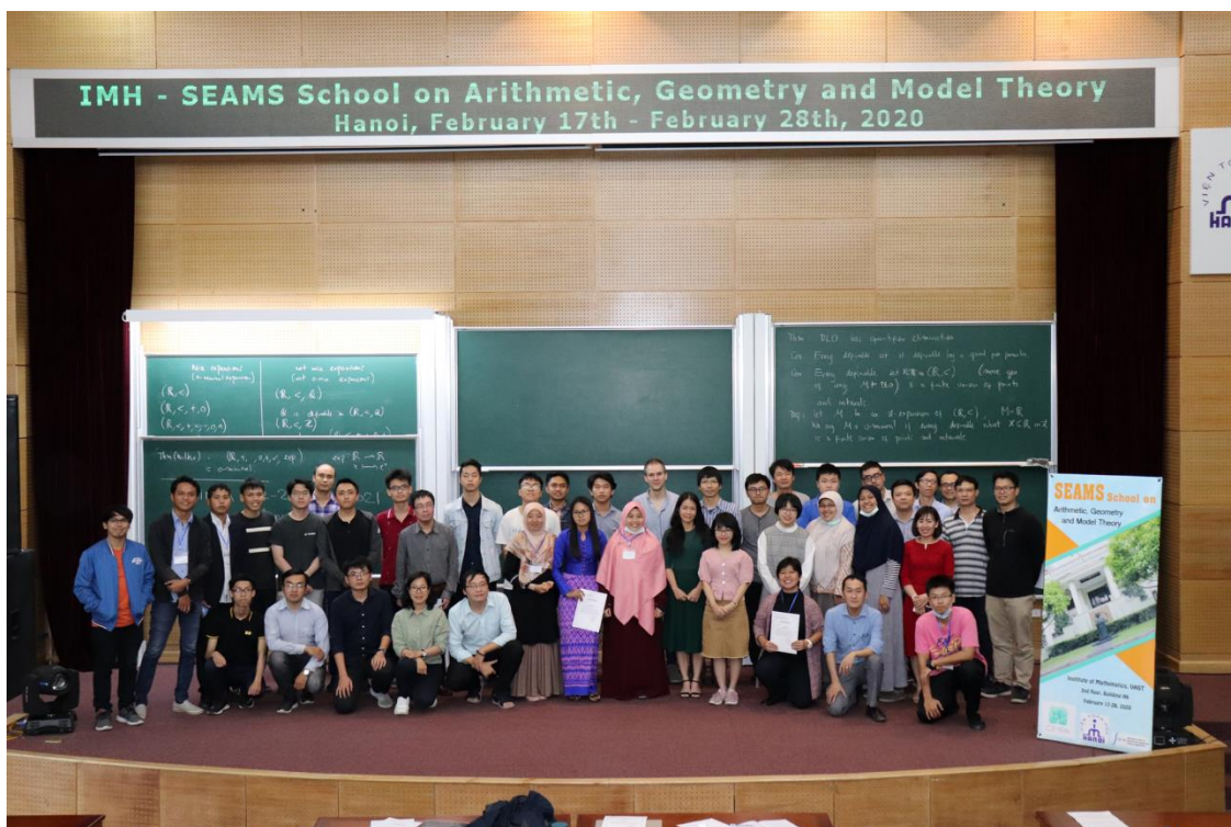
Last day-take a photo together