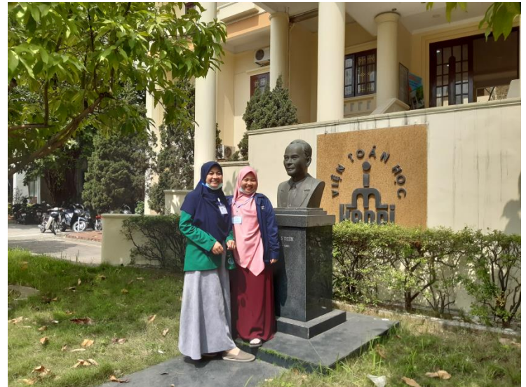
Around of campus