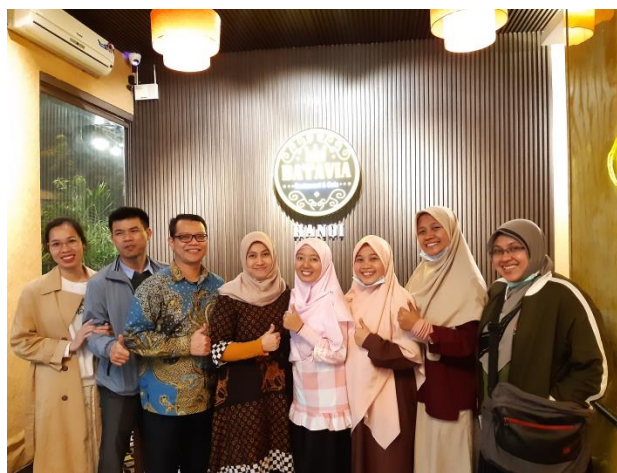
Take a photo with KBRI in Vietnam